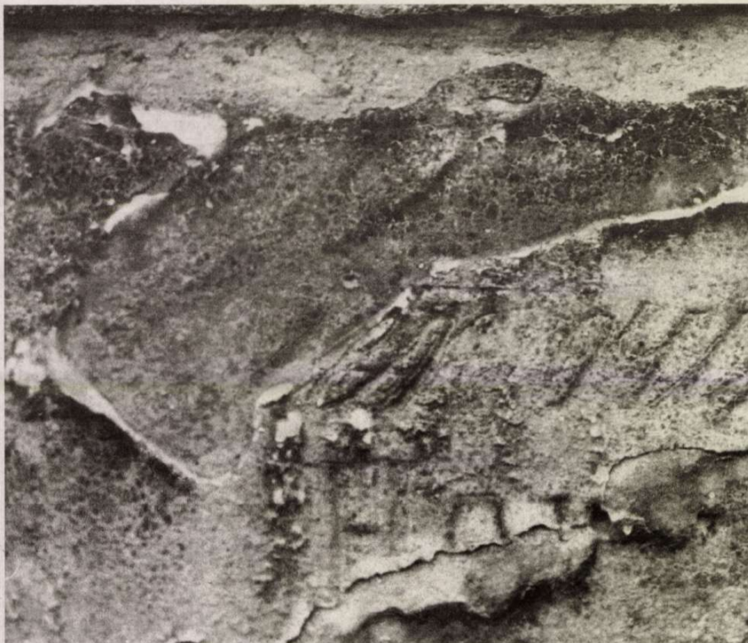
Frankl Aliona fotogramja

A tradicionalizmus egyik alaptanítása, hogy