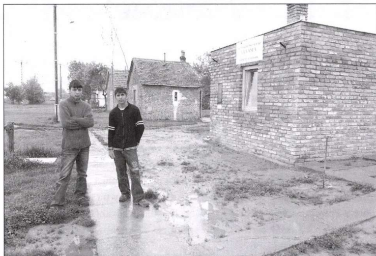
Előtérben az épület, ahol a tanítás folyik

- Jobb és nehezebb helyzetű családok egyaránt vannak, ám eddig egyik se szervez-