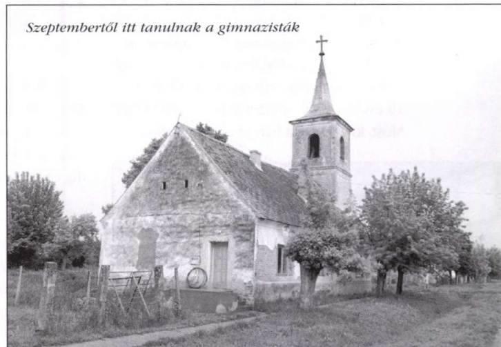
Szeptembertől itt tanulnak a gimnazisták

Engem leginkább a görög városállamokban kialakult szabad iskolák oktatására emlékeztem az itteni. Bárki benézhet a „tante-rembe”, meghallgathat egy órát, és ha tetszett, amit látott, beiratkozhat. Van, aki le- vagy kimarad, de melyik iskolában nincs ilyen? Egyébként ha valaki azért hiányzik gyakrabban, mert beteg a gyereke, vagy az erdőre kellett menni fáért, pótolhatja az elmulasztottakat, nem zárják ki az iskolából. Sajátos a program és a tanítványok sem átlagosak.